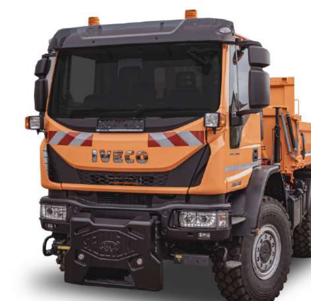
КОММУНАЛЬНАЯ ДОРОЖНАЯ МАШИНА