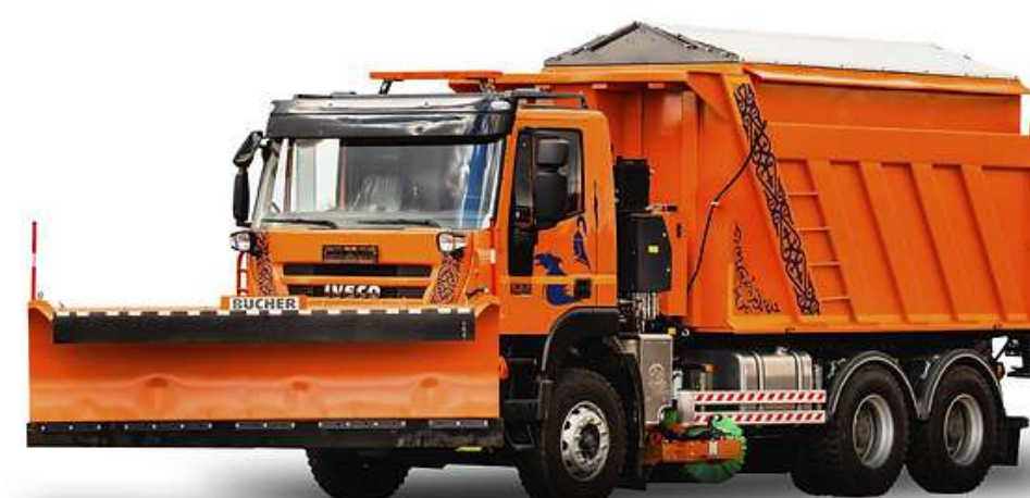
КОММУНАЛЬНАЯ ДОРОЖНАЯ МАШИНА