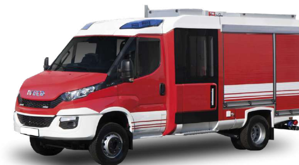
СПЕЦ. МАШИНЫ (СКОРАЯ, ПОЛИЦИЯ, ПОЖАРНАЯ)